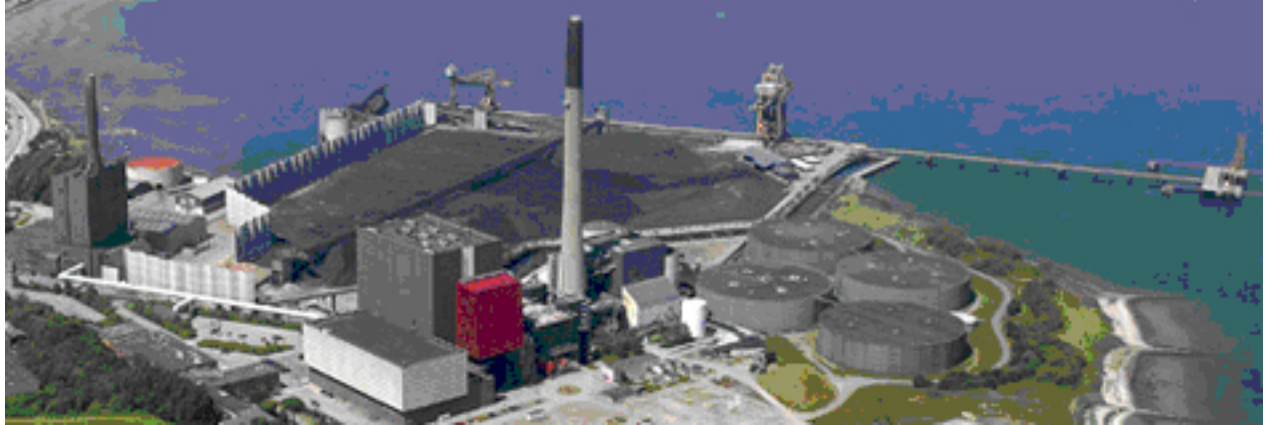
Figur 1. Kulbunker ved Enstedværket i Åbenrå. Væggen opført vest for værket (tv. på billedet) er en støjskærm.