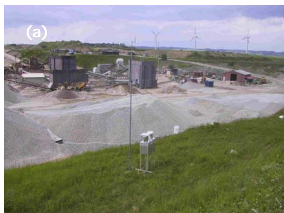
Figur 4. Eksempler på kampagnemåling ved brug af vindretningsbestemt støvfaldsopsamler "MET-DUST": Måling for støvnedfald nær ved en grusgrav (a), og måling nær et metalskrotanlæg (b).

ofte vindretningsbestemte målinger af støvnedfald, da disse kan give mere præcise informationer om, hvor støvet kommer fra. Klæbefoller kan også være nyttige til støvfaldsopsamling, specielt til at måle belastningen over kortere perioder. Figur 4 viser et eksempel på en måling med en vindretningsbestemt opsamler til støvnedfald.